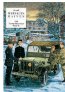
Le tome 2 est sorti.

Raives est également le coloriste attitré de Jean-Claude Servais. Il s'est donné cette anagramme afin de ne pas être confondu avec le Gaumais, avec qui il partage le même nom. Son dernier album, "Les Temps Nouveaux - Entre Chien et Loup", tome 2, est sorti aux éditions Lombard, dans la prestigieuse collection Signé. Un excellent album du binôme Warnauts-Raives.