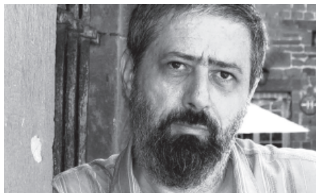
"Tous les résistants n'étaient pas que des gens fréquentables."