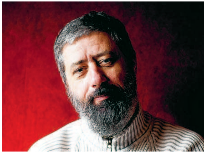
"Mon meilleur souvenir à Angoulême? Ma première rencontre avec Hugo Pratt". ■ LE LOMBARD/2010