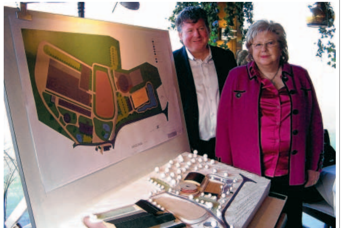
Les époux Spiritus-Beaugnee ont créé une fondation pour garantir la pérennité du projet. ■ N.L.