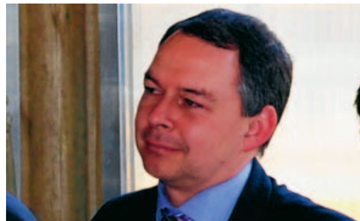
Le bourgmestre attend aussi un nouveau zoning de 5 hectares. ■